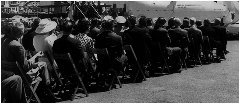
Baptême d'Alvin, 1964.

Comme dans toutes les meilleures pépites le héros part à l'aventure sous un prétexte trivial qu'il oubliera vite. Mercuri explique, dans un making of du livre, que tout serait parti de la découverte d'un crabe poilu au fond de l'océan et du submersible qui plongea si profondément pour l'y découvrir. Nous avons notre héros et son nom est Alvin (nom complet : Alvin DSV-2). Sur le papier, on reverra le crabe, mais les choses s'organisent différemment. Ça part donc du régicide contemporain ultime, puis il y a cette histoire de bikini et cette bombe larguée par accident au large de l'Espagne. Une bombe qui, histoire hallucinante, vérifiable et vérifiée, n'a miraculeusement pas explosé. Nous sommes alors en pleine Guerre Froide, Alvin doit la retrouver. Le début de l'aventure... Efficace, le parchemin que déroule Mercuri sautille la tête au vent comme la comptine des Trois Petits Chats faisant de la sérendipité un principe heuristique efficace. Le genre de truc qui aurait foutu la rage à Rouletabille :